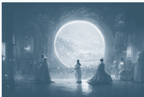
这由人工智能把「作者」的文字转为画作的作品，在一比赛中赢得冠军。

对于心的探寻，我们中国文化拥有巨大的积累，有待慧者发扬。能否在人工智能诞生的时机上，为人类文明指出一个光明的方向，就看我们这一代人的努力，时不可再！（本文完）