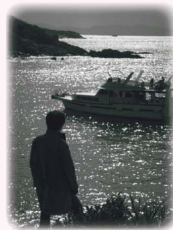
現代人要回頭，就得重新向生命請教

第二、是理性。人有理性，亦即知性，想知道外面世界變化的秘密，去了解我們生活的環境。知性的源頭是理性，懂得思考、懂得選擇、懂得比較、懂得計算。懂得思考、計算，這是邏輯理性、數學理性，這在很古老的時代已發現。孔子的六藝也包括數學，古希臘時代的哲學家幾乎全部都是數學家，他們都懂數學。畢達哥拉斯就是講數學，二千幾百年前，便講出宇宙是數。我們通過邏輯思維，知道思想要有法度、要有規則，然後用以處理經驗，便發展成為科學理性。科學理性是近代的東西，以十六世紀培根（F. Bacon）