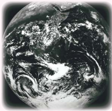
是人自己把地球弄得千瘡百孔

命運。人的命運是自己造出來的，所以很有可能要走到大死亡的階段，人類毀滅。在天地的歷史之中，再沒有人類。到現在為止，在其他星球中沒有發現過人類，只有地球曾經出現過。但人類首先弄死自己的母親，即是弄死大地，然後令自己無處生存。霍金說我們可以移民至外星，他很樂觀，其實也很天真幼稚：試想六十億人如何移民？萬分之一也移不了。你看過鐵達尼號，當時還有文化，船沉沒時還會讓女人小孩先上船，人還會排隊。若現在發生，你以為還會排隊嗎？為甚麼要讓別人？因為文化死亡了，餘下的便是自私、殘忍，很醜惡。過去人的死亡要有莊嚴的