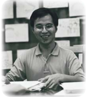
作者攝於觀塘總部