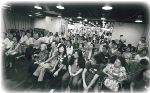
文化中心充滿了喜耀的面孔

為慶祝法住廿五周年銀禧紀念，上月底法住文化中心舉行了「喜耀生命」高階重聚日。高階課程的鍛煉對很多「喜耀」學員來說，刻骨銘心，只因在短短四十九天裡須落到生活中，真切面對自我、接受磨練、實踐承諾、突破難關，以至與同學甘苦與共、互相勉勵，以將喜耀教育文化之理想付諸實行。五月廿七日，近二百位曾參與高階課程之學員，當中一些闊別多時的舊臉孔，都回到法住文化中心出席重聚日，大家除了緬懷一番，更對法住事業近年的全方位發展重新了解，內心不禁再度熾熱起來。