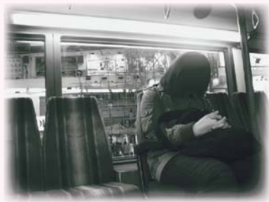
個人主義盛行，結果人人封閉、人人孤獨

其實是非常封閉、非常不信任、十分懷疑人，所以很難跟人相通。因為不開放，怕吃虧，怕被人佔便宜，於是將自己藏得很緊。為甚麼現代社會人人都狹隘，自私？原因在此。到最後人人封閉，人人孤獨。孤獨而生，孤獨而死。許多家長教小朋友