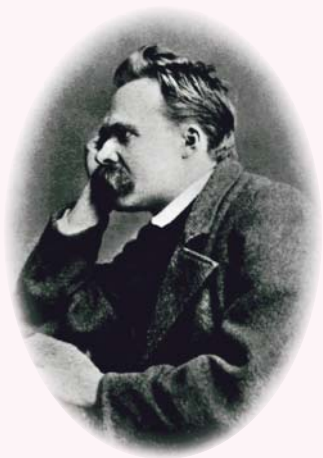
尼采宣布上帝已死，其實是忍受不了權威

到最後，必然是大死亡。這個死亡很可能是人自己殺死自己。二十世紀初尼采已經預言上帝死亡，是我們殺死上帝。因為人不信上帝、人不服氣，如尼采要做超人，挑戰上帝；他的自我很強，但卻扭曲。他包裝他的自我，美其名為 the will to power（權力意志），其實只是自我罷了。他是非常自我的人，其實也很自卑，時時怕人看不起他；這些人你碰一碰他便會爆炸，他很緊張。從心理學講這些人會精神崩潰，尼采後來真的精神崩潰。為甚麼會崩潰？因為他很緊張，一天到晚要跟人比，要做超人，要超越別人。我最近講《莊子》，有個寓言：有一個善於養雞的人，為其國王養鬥雞。十天後，國王問：那雞可以出場了嗎？養雞人說：還未可以，因為太浮躁，整天想打架。再養十天，國王問：可以了嗎？養雞人說：還未可以。因為牠看到另一隻雞的影子，已經想飛撲過去。再養十天那隻雞仍然怒目盛氣，一副高視闊步的樣子。最後，過了四十天，養雞人說：可以出戰了。為甚麼？因為牠已經靜下來，「望之似木雞」，其他雞走過牠也不會動，「其德全矣，異雞無敢應者」。我解釋此寓言時舉了一個很淺白的例子：就如戰場上的老兵。新兵都很緊張，不但流著汗，還緊緊拿著槍；老兵呢？聽到槍聲，會說：還沒有這麼快打起來，先睡一會兒，養足精神吧。敵人還未進入射程，哪需要緊張？這也好像武俠小說寫的劍客一樣，武功高強的大俠，那劍不會隨便拔出來；他坐在那裡，你已經怕了。那些拿著劍四處找人打架的，當然沒有用。那隻養了四十天的雞就是如此，結果一放出去，其他的雞都怕了，都走了，因為牠的反應是如此不同，沒有雞敢走近。這是不戰而勝，如《孫子》所說的不戰而屈人之兵。我舉這個例子，