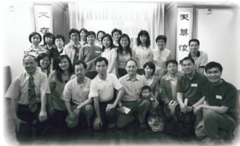
第一至五屆高階同學合照