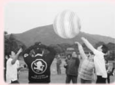
大家都投入於每項活動

當日的午膳亦令人回味不已，同學像芸娘一樣，自攜炊具，備食品，共準備了近三十款美食，大伙兒一邊品嚐佳餚，一邊欣賞美景。