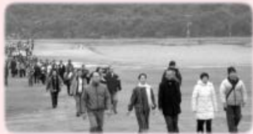
霍院長率百多位同學「早春行」

一月八日，百多位同學在霍院長的帶領下，參加了「早春行」的活動。當日早上九時，眾人齊集於馬料水碼頭，朝著西貢的深涌出發。首度舉行的「早春行」有別於一般的郊遊，同學們在大自然中學習，這次活動的主題是「天地的生機與新機」，就是要同學們學習敞開心扉，感受天地。