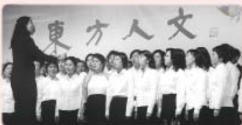
「喜耀」合唱團及同學獻唱性情之歌

『東方人文』，顯示我們對西方十五世紀人文主義的反思。我們常說以人為本，市場以人為本，產品以人為本，廣告以人為本，但這個『人』代表甚麼意思？是滿足人的本能？人的欲望？人的享受？人心目中的自由？……這正是西方人文主義由十五世紀發展到二十世紀的結果，所以人的結構只是生理與心理的……須知人生的成長，是要逆我們的本能而前進，文化的修養、道德的修養、性情的開發是逆，不是順；但西方的人文主義則是順，順我們的