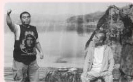
讀書人為只懂爭取權益的人找到出路

接著是當晚的重點演出：話劇《陷落與走出》。劇中人受流俗影響，或只會空想發夢，或只知講求權益，或只知為名利拼搏，或封閉在個人世界裡……在某寧靜的村莊裡，他們分別遇上「漁、樵、耕、讀」四人，生命都因而得到啟發。這些啟發其實都來自東方人文的滋潤；而東方人文的生命力，見證於一代代人的生命成長。於是，一群認真學習的孩子，走到台上，表現了他們上課學習《論語》的現實情況，孩子透過《論語》的學習，從心底生起孝順父母、友愛兄弟、珍惜友情的真性