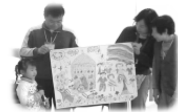
心裡關愛更多的人

親親營臨別之前，我們一起回顧這兩天的學習，每一個都涵有深遠的意思。入營首天，每個家庭都合力畫了一幅畫，以表達理想的家；這時大家再畫一幅，發現到大家的作品都繽紛了、心開了，而且與人更親近，對更多人關懷了。最後我們一連唱了多首性情歌曲，每首歌曲也連繫著每個活動的情節，令大家回味無窮，總結了這個溫馨而又輕鬆的假期。