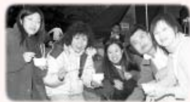
作者(左二)與同學合攝

另一方面，我也學會感恩。天地給我一份寧靜，令我的心靈得以安頓；亦使我看到自己的不