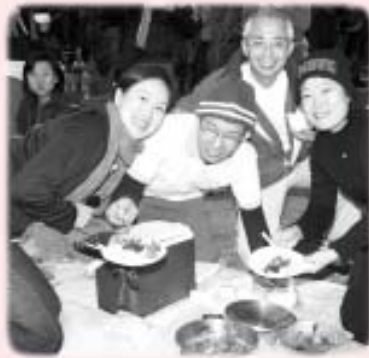
同學仿做芸娘自備炊具，即場炮製美食

當日的午膳亦令人回味不已，同學像芸娘一樣，自攜炊具，備食品，共準備了近三十款美食，大伙兒一邊品嚐佳餚，一邊欣賞美景。