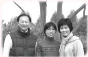
作者(中)與初心禪同學合攝