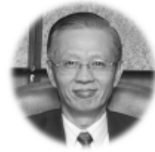
唐先生之哲學，其心靈永不陷落於一家，千門萬戶，都有通道；出入無

由唯識宗之經驗分析，到最後未能圓滿解釋成佛根據，唐先生進而言華嚴宗之真心思想。此宗上承地論、攝論之爭辯，經《大乘起信論》之整合，而確立為真如隨緣不變之說，即理徹於事，倒過來亦可以說是事徹於理，於是成一理事無礙，事事無礙之圓教。唐先生指出：中國佛學沿印度般若學之路，以融會印度大小乘及諸經，最後歸宗法華圓教者，乃天台智顛之一大創造；至於沿印度瑜伽法相唯識之路，以融攝般若及大小乘佛學，最後歸宗華嚴圓教，乃華嚴法藏之另一大創造。天台宗之大成，一表現於其判教，一表現於其止觀；華嚴宗亦然，其言判教，純從義理層次之升進，以與佛說法之次序，初由小而大，大之由始而終，與教之由漸而頓，由頓而圓，非常吻合。故唐先生認為：較之天台藏通別圓之名義尚有曖昧者更勝。再如言止觀，華嚴有多種名目，如真空觀，理事無礙觀、周遍含容觀，其中或自空有相奪說，或自理事相奪說，或自一切法相即相入，彼此交涉無礙說，最後皆歸結為一切法互為主體，在如來海印定中炳然呈現；此即華嚴之圓觀。唐先生指出：一般人雖知相即相入之重要，但不知華嚴之相即相入，必須先歷大乘始終二教，再經頓教之相奪，方可言相泯、相隱、相入。