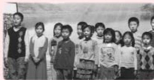
學習《論語》的小孩子也參加演出

接著是當晚的重點演出：話劇《陷落與走出》。劇中人受流俗影響，或只會空想發夢，或只知講求權益，或只知為名利拼搏，或封閉在個人世界裡……在某寧靜的村莊裡，他們分別遇上「漁、樵、耕、讀」四人，生命都因而得到啟發。這些啟發其實都來自東方人文的滋潤；而東方人文的生命力，見證於一代代人的生命成長。於是，一群認真學習的孩子，走到台上，表現了他們上課學習《論語》的現實情況，孩子透過《論語》的學習，從心底生起孝順父母、友愛兄弟、珍惜友情的真性